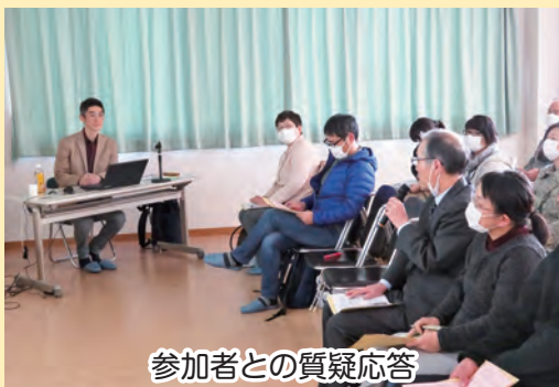
参加者との質疑応答

那須烏山市心身障害児者父母の会では、心身障害児者の福祉増進を図ることを目的に活動しています。入会を希望される方は、社会福祉協議会までご連絡ください。