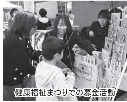
健康福祉まつりでの募金活動

市民の皆様をはじめ、企業、学校、商店など多くの方々から温かい善意をいただき、心よりお礼申し上げます。 皆様から寄せられた募金は、栃木県共同募金会を通じ、県内の民間施設や那須烏山市社会福祉協議会に配分され、援助を必要とする方々への地域福祉事業に使わせていただきます。