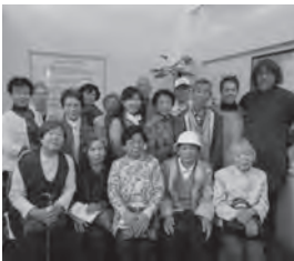
カナリア会 日帰り旅行