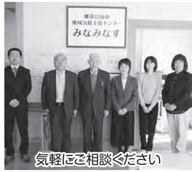
気軽にご相談ください

4月1日、本会では、保健福祉センターに「那須烏山市地域包括支援センターみなみなす」を開設した。