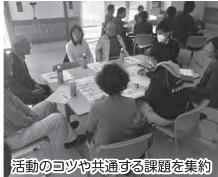
活動のノウハウや共通する課題を集約

人口減少・少子高齢化が進展する中、安心して暮らせる地域づくりを目指して、自治会や民生委員児童委員、ふれあいの里などの実践者による情報交換会が実施された。