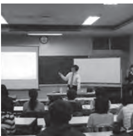
手話サークル 講演会