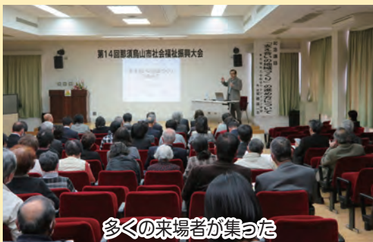
多くの来場者が集った

2月23日、第14回那須烏山市社会福祉振興大会を南那須公民館で開催した。約180名の関係者参加のもと、永年にわたり社会福祉活動の功労者、多額の浄財の寄付者など、44人と11団体に表彰状、感謝状が贈られた。