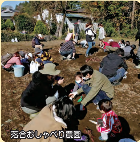
落合おしゃべり農園