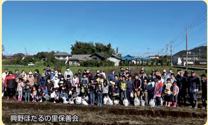
興野ほたるの里保善会

11月末から12月初めにかけて、市内各地でサツマイモ掘りイベントが開催され、どの畑も大勢の参加者で賑わいました。 地元の方から指導を受け、次々と立派なサツマイモが掘り起こされていきました。今年は、コロナの影響で焼き芋等の試食会はできませんでしたが、それでも自分で掘り起こしたサツマイモを両手に抱えた参加者の皆さんには、文字通り「ホクホク笑顔」が溢れていました。 参加した子どもたちに、好きなサツマイモメニューを聞いたところ、「スウィートポテト」「大学イモ」「イモ羊羹」との回答が多く、自分が掘ったサツマイモがおやつになっ出てくることをとても楽しみにしているようでした。 主催者の方たちは「子どもたちに農業体験をさせたい」「子どもから大人までが集まれる地域交流の場を作りたい」「コロナの影響で、外出を自粛している方が多い中、外の良い空気を吸い、秋の日の家族の楽しい思い出を作ってもらいたい」と話していました。