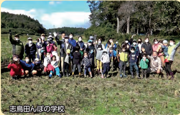
志鳥田んぼの学校