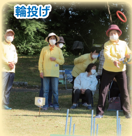
下川井下いきいきクラブ