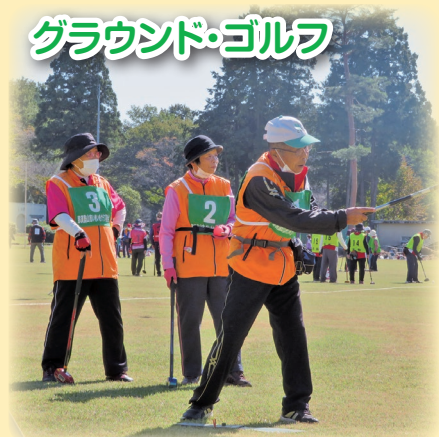
入滝田いきいきクラブ