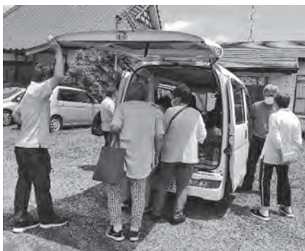
移動販売車による買い物

戸別の訪問では世間話で終わってしまいますが、最近では何気ない会話の中から見えてくるものが多いと感じています。