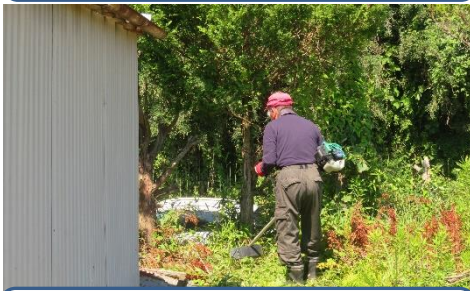
草刈 & 除草剤散布

登録者数 令和5年3月31日現在 希望者数：84人 協力者：55人 活動実績 定期活動（見守り訪問）： 延べ351件 随時活動（生活援助）： 延べ 52件 （内対応不可の為他事業所を紹介： 13件）